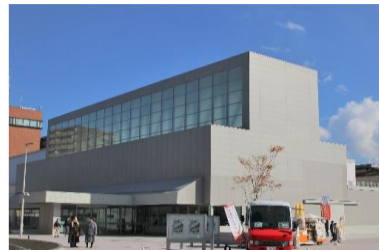
<八戸市美術館 外観>