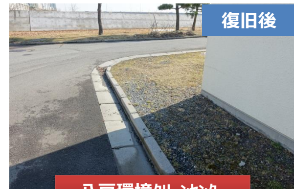
八戸環境センター