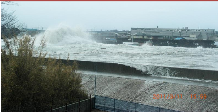
破堤の様子 (五戸川河口部)

東日本大震災では五戸川で引き波と押し波が衝突し堤防から越流