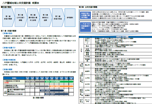
地域公共交通計画_概要