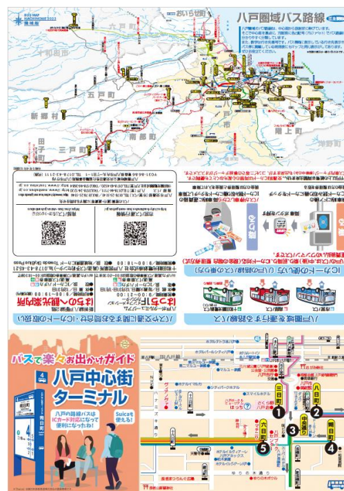
八戸中心街ターミナルリーフレット