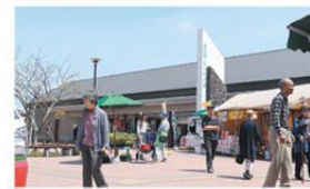
道の駅 ウトナイ湖

<道の駅 ウトナイ湖> 苫小牧市字樋苗156-30 TEL 0144-58-4137 営業時間/9~18時(11~2月 9~17時) <道の駅 ウトナイ湖 プレジール> 苫小牧市字樋苗156-30 道の駅ウトナイ湖内 TEL 0144-58-2677 営業時間/9~17時(11~2月 9~16時30分) 定休日/年末年始 ●苫小牧西港フェリーターミナルより 約11km