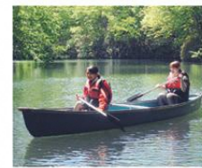
オートリゾート苫小牧 アルデン

五つ星オートキャンプ場「アルデン」はカヌーなどのアクティビティや温泉施設も人気。