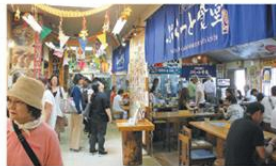
海の駅ぷらっとみなと市場

名物ホッキカレー1,000円(税込)を堪能あれ。通常盛りでもご飯とカレーはそれぞれ2杯分のボリューム。