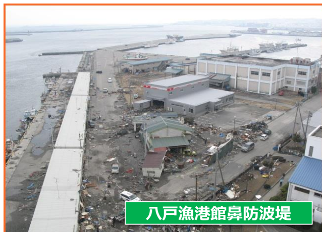
八戸漁港館鼻防波堤 復旧前