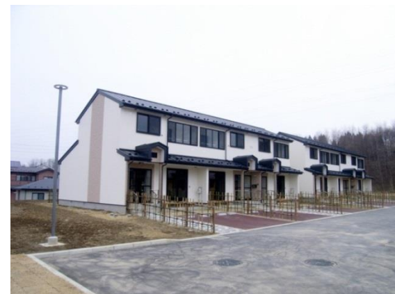
白山台災害公営住宅