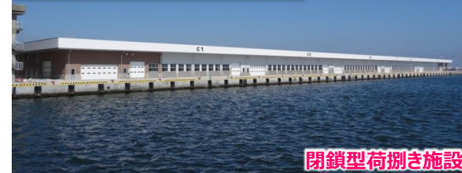
閉鎖型荷捌き施設