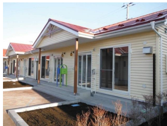
新井田道災害公営住宅