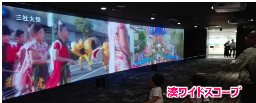
湊ワイドスコープ