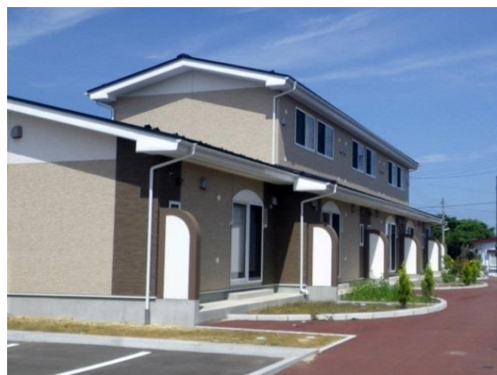
多賀台災害公営住宅