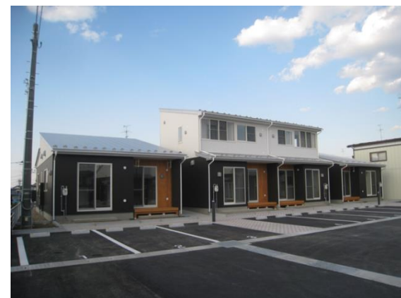
白銀いかずち災害公営住宅