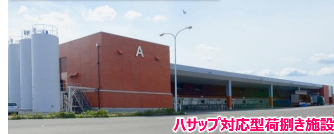
ハサップ対応型荷捌き施設