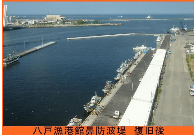
八戸漁港館鼻防波堤 復旧後