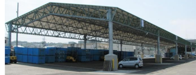
第三魚市場荷さばき所 A 棟