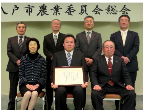
後継者顕彰を受けた釜石さん（中央）