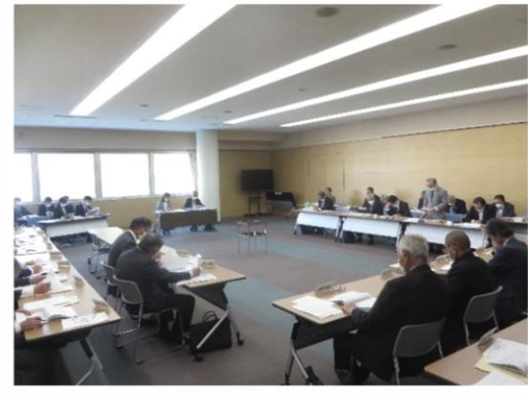
八戸市農業委員会令和5年度5月総会