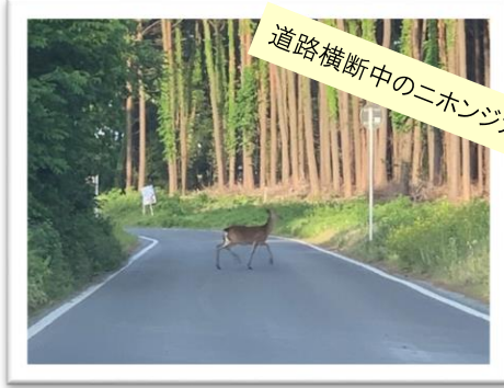
道路横断中のニホンジカ

農林畜産課(43-9052)へ連絡してください。目撃した動物の種類、場所等を教えてください。また、南郷地域で目撃した場合は、南郷事務所(82-2113)へ連絡してください。