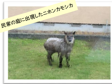
民家の庭に出現したニホンカモシカ