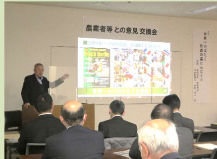
講演する柏崎代表取締役

講演後の意見交換では、参加者からの様々な意見に対し貴重なアドバイスをいただきました。