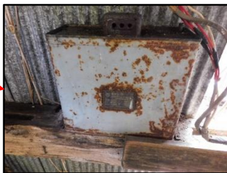
低圧進相コンデンサ※