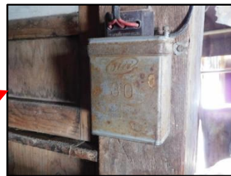
低圧進相コンデンサ※