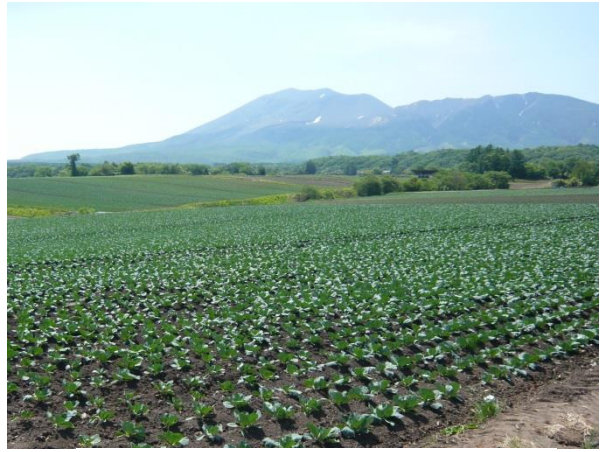
浅間山を望む嬭恋村のキャベツ畑

5月26日から28日にかけて、三八地区農業委員会会長による視察研修及び県選出国会議員への要請活動を行い、また全国農業委員会会長大会へ出席してきました。