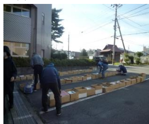
(3) リサイクルフェア