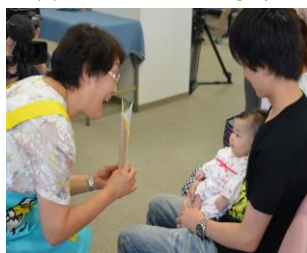
(2) ブックスタート事業