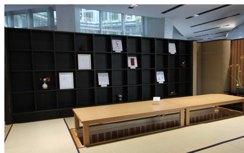
・3階 八庵 色紙展示