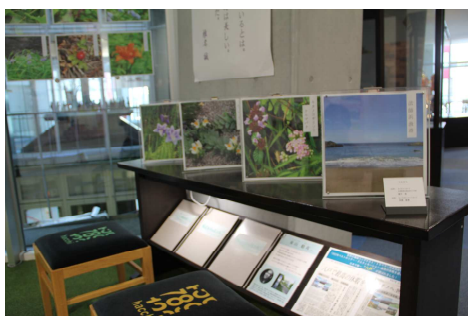
・2階 種差海岸 写真展示