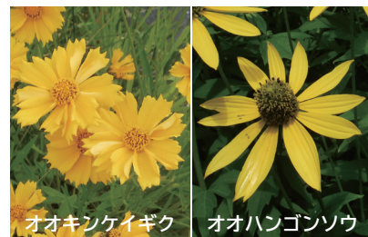
オオキンケイギク オオハンゴンソウ

5～10月ごろにかけて黄色の花を咲かせるオオキンケイギクやオオハンゴンソウは特定外来生物に指定されており、栽培などが禁止されています。