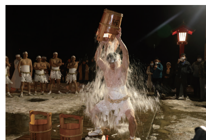
冷水を浴びて、心身を清める水垢離の様子