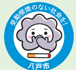
受動喫煙対策推進マスコット「けむいモン」

※喫煙室を設置または届け出をした飲食店は、施設や喫煙室の入口に標識を提示しなければなりません。