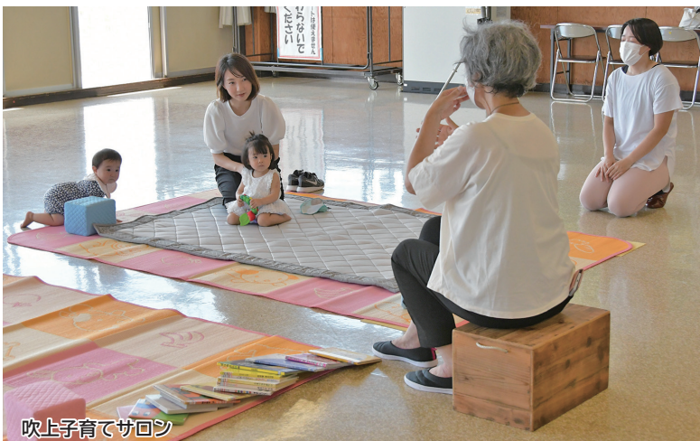
吹上子育てサロン