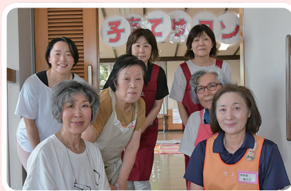
吹上子育てサロンスタッフの皆さん