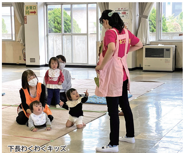
下長わくわくキッズ

各地区の公民館や児童館で開催される子育てサロンは、広いスペースで小学校入学前のお子さんが安心して遊ぶことができます。お子さんの年齢に応じたさまざまなイベントも行っていますので、同じ年頃のお子さんと一緒に遊ぶ機会にもなります。子育て中の親子が気軽に集い、仲間づくりを通して子育てに関する相談や情報交換などを行うことができます。