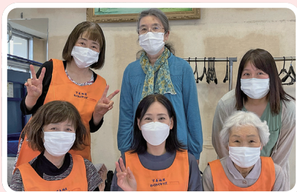
下長わくわくキッズスタッフの皆さん

子育てサロンのスタッフは、地域のボランティアの皆さんが主体となっています。各地域では、子育てサロンの準備、運営のお手伝いに参加していただける人を募集しています。子育てサロンに集うスタッフや子育て世代の皆さんとの交流を通して、地域で支え合う子育て活動に参加してみませんか？