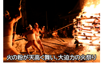
火の粉が天高く舞い、大迫力の火祭り

二戸の冬の風物詩でもあるこの祭典では「オコモリ」「水ごり」「裸参り」「火祭り」が順に行われ、オコモリの崩れ具合と火の粉の舞う方向でその年の作柄を占めます。