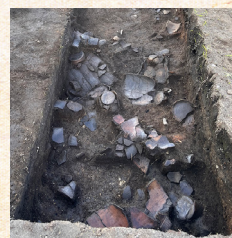
盛土遺構の遺物出土状況

今回は、是川縄文館の後ろに広がる一王寺遺跡の発掘調査をご紹介します。一王寺遺跡は「是川石器時代遺跡」の一つで、これまでの発掘調査によって縄文時代前期から中期(約5,900～4,300年前)の大きな集落(ムラ)であることがわかっています。今年度の調査では、土器や骨片などの遺物を多く含む盛土遺構が遺跡の南側に広く分布していることが確認されたほか、縄文時代当時の一王寺は、現在よりも起伏に富んだ地形であることがわかってきました。発掘調査は来年に続きます。お楽しみに！