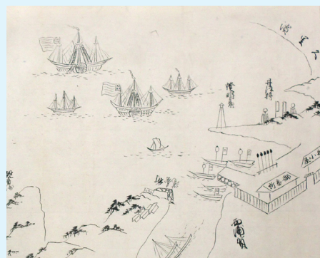
外国人軍事図巻(もりおか歴史文化館蔵)