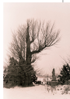
昭和41年1月11日