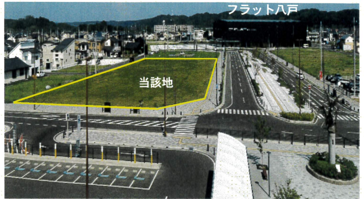
八戸駅西口から当該地方面を臨む