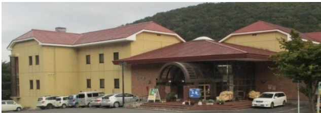
十和田市焼山地区