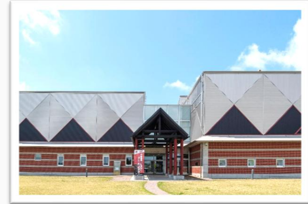
八戸市埋蔵文化財センター 是川縄文館