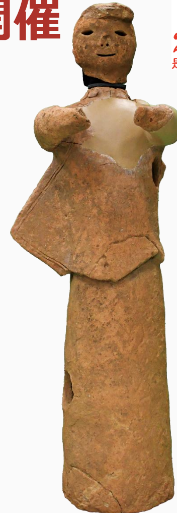
巫女埴輪 天王森古墳/ 下松市蔵