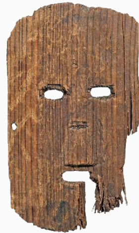
木製仮面 西岩田遺跡/ 大阪府文化財 センター蔵

会期：9月26日(土) ～11月3日(火・祝) 会場：是川縄文館 2階企画展示室ほか 観覧料：大人500円、 中学生以下無料