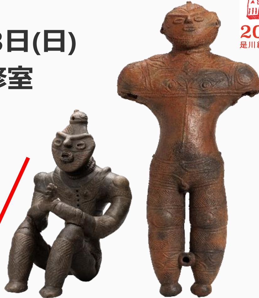
国宝「合掌土偶」 八戸市蔵