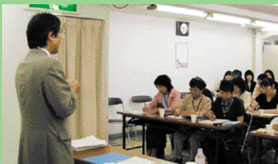
基本条例をクイズ形式で学習

はちのへ女性まちづくり塾は、八戸市が男女共同参画推進事業の一環として、積極的に政策や方針決定に参画する女性の人材を育成するために実施しています。