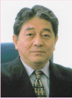
八戸大学・八戸短期大学