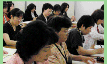
30代～60代と幅広い年代の受講生

6期目となる本年度は、仕事を持っている方も受講できるよう、土曜日や夜の講座も設けています。また小さいお子さんがいる方には託児室を用意するなど、たくさんの方が気軽に参加できるようにしました。