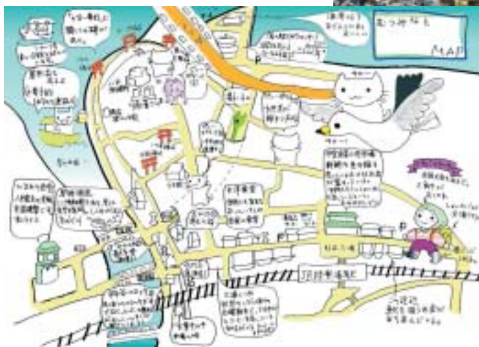
ワーキング会議で作成したむつみなとマップ