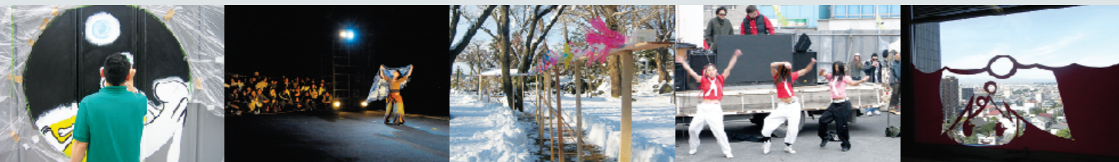
H20.6.29 ストリート キャンパスライブ

当施設の開館を見据え、市民からの提案をもとに開館プレ事業を実施しています。現在まで16回の事業を行いました。