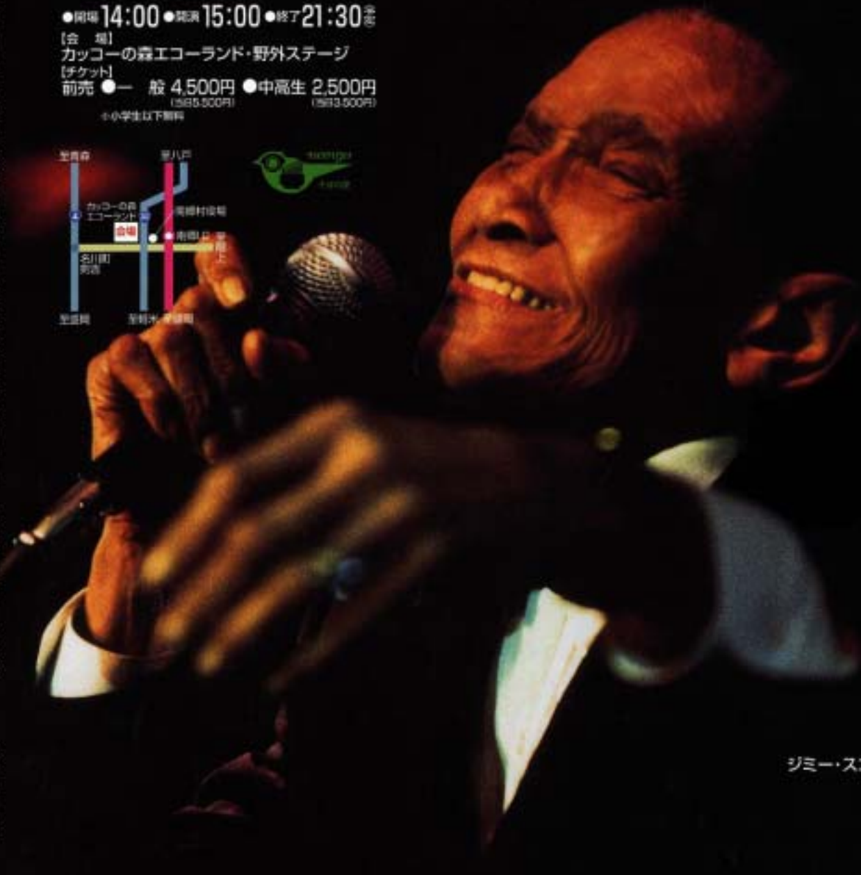
ジミー・スコット (vo)