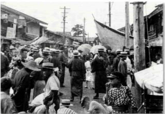
大正十年ころの市日の様子／第一章扉掲載