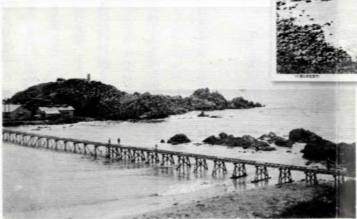
最各地噴器これみう 物念記念天然内境社神島巖殿