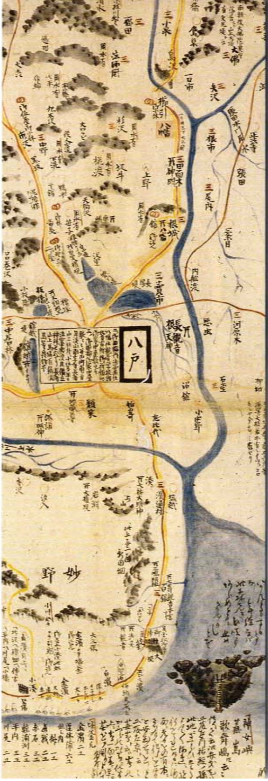
八戸御領内絵図（八戸市立図書館所蔵・八戸南部家文書）／付図掲載