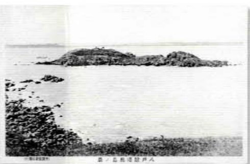
橋が架かる前の様子